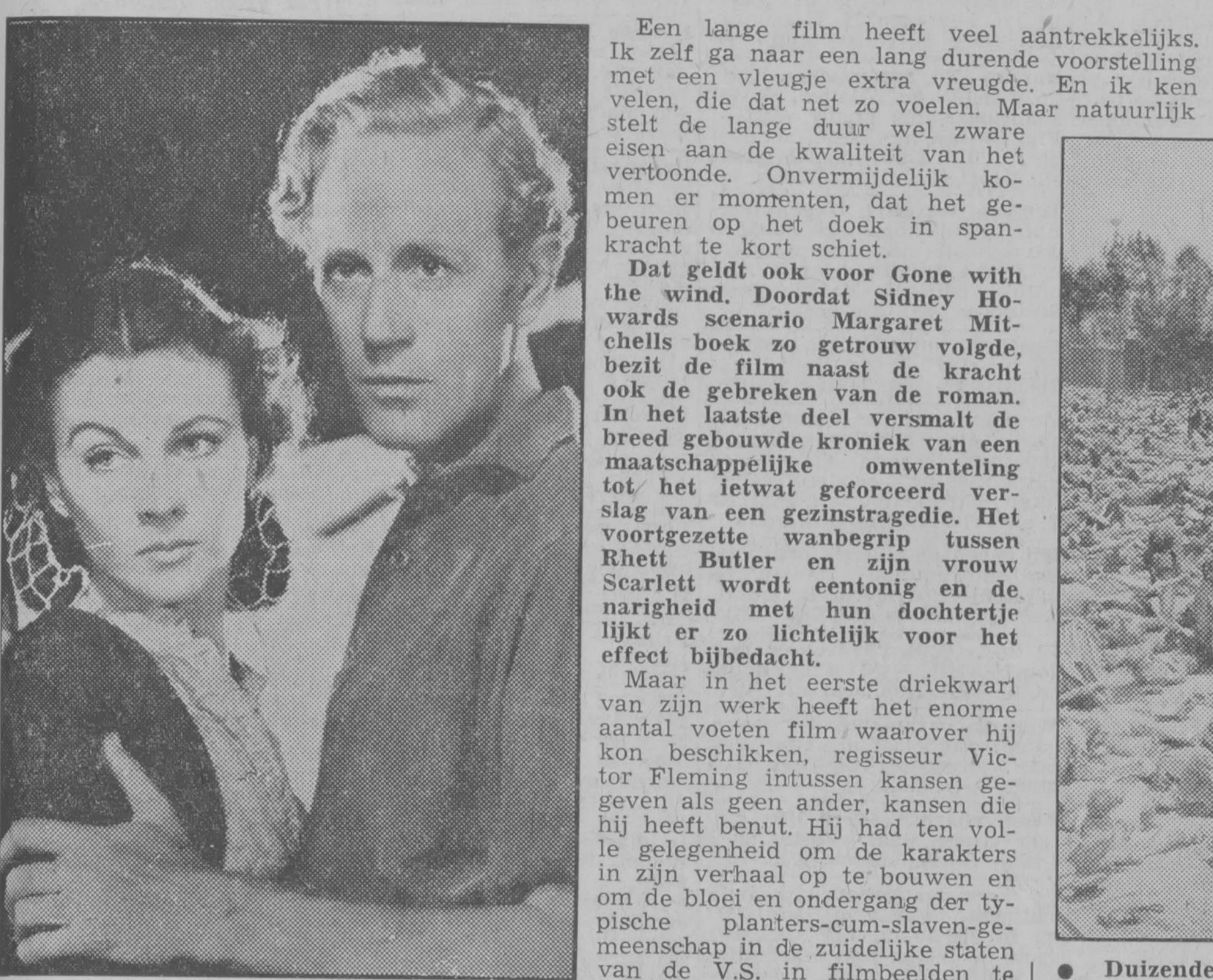
Vivien Leigh in een scène met Leslie Howard, die in de oorlog sneuvelde.