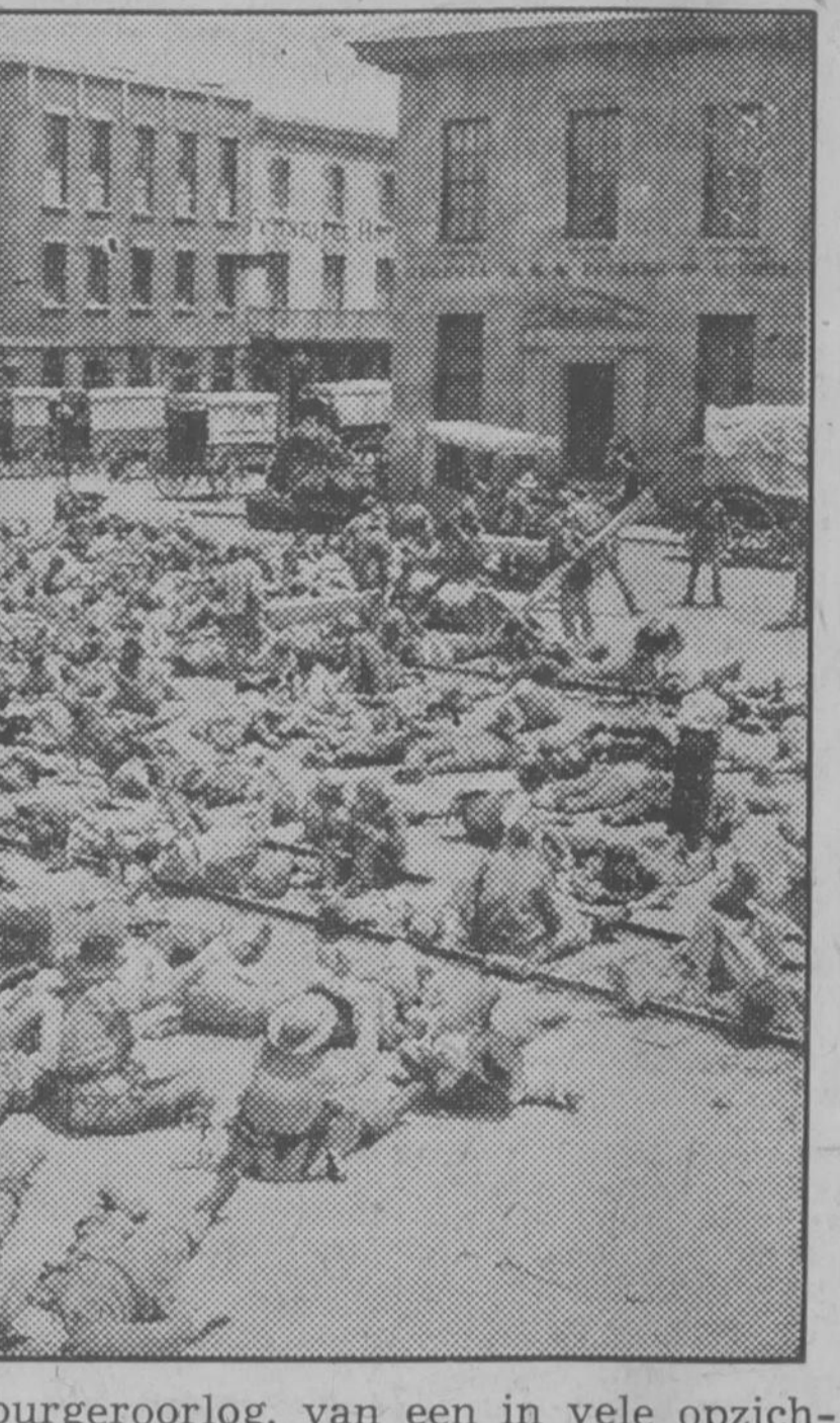
Duizenden gewonden liggen uitgestrekt op het stationsemplacement van Atlantic City