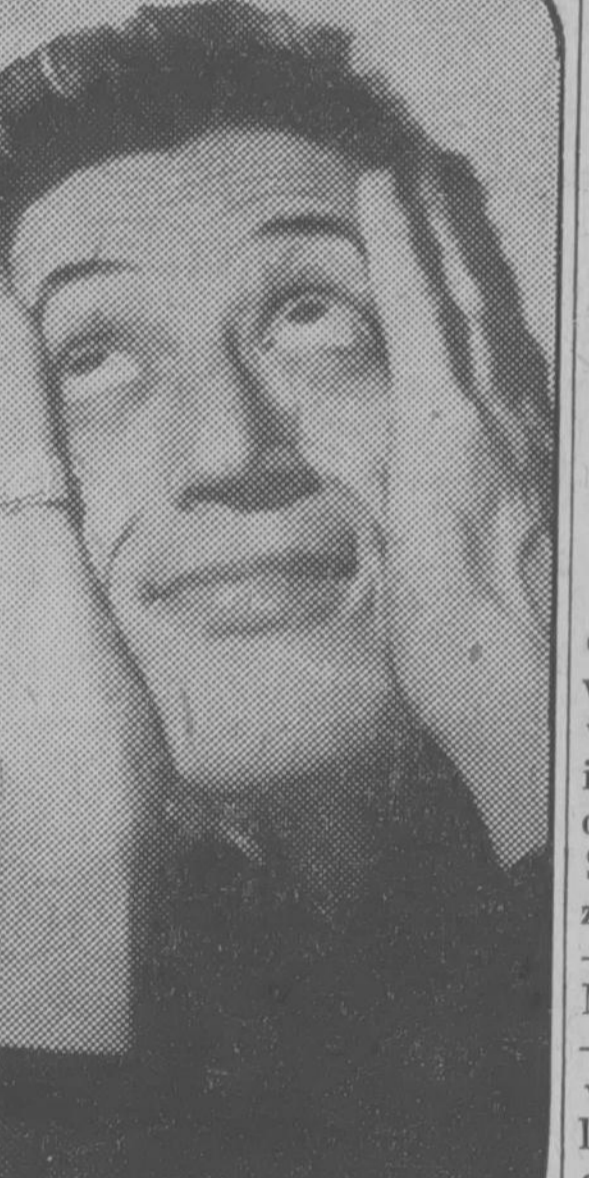
Philippe Clay: door zijn grammofoonplaten in ons land bekend.