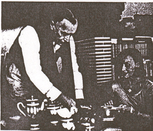
Erich Maria Remarque, der Autor unseres neuen Romans «Die Nacht von Lissabon», mit seiner Gattin, der aus Chaplin-Filmen bekannten Schauspielerin Paulette Goddard.

Erscheint ab nächster Nummer als exklusiver schweizerischer Vorabdruck in der «Sie und Er». Wir besuchten den Verfasser in seinem Heim in Porto Ronco, wo er uns über die Entstehung und menschlichen Hintergründe dieses Werkes berichtete.